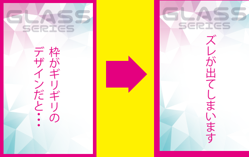
枠のあるデザイン例

同系色のデザインを重ねた場合、同化する可能性があります。 細かいデザインの場合、擦れたり、潰れたい場合があります。 (罫線は最低0.2mm以上、文字は細い書体なら 4 pt以上)