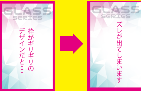
枠のあるデザイン例

同系色のデザインを重ねた場合、同化する可能性があります。 細かいデザインの場合、擦れたり、潰れたい場合があります。 (罫線は最低0.2mm以上、文字は細い書体なら 4 pt以上)