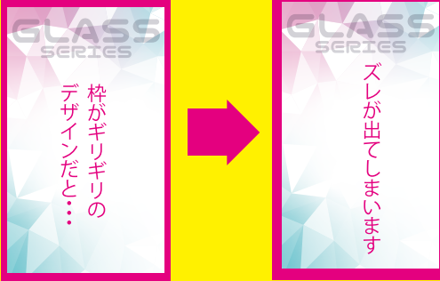
枠のあるデザイン例

印刷・断裁で多少のズレが発生してしまうため 仕上がりギリギリのデザインをするとズレが生じます。 特にフクで囲むデザインなどはちょっとしたズレでも 目立ってしまいますので出来るかぎりお控え くださいますようお願いします。