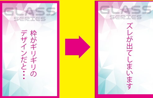
枠のあるデザイン例

印刷・断裁で多少のズレが発生してしまうため 仕上がりギリギリのデザインをするとズレが生じます。 特にワクで囲むデザインなどはちょっとしたズレでも 目立ってしまいますので出来るかぎりお控え くださいますようお願いします。